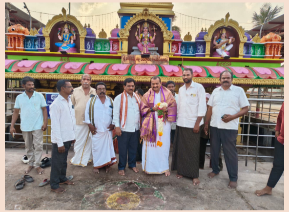
కాకుమాను రక్షణ న్యూస్

ప్రముఖ సినీ దర్శక నిర్మాత బండ్ల గణేష్ సోమవారం కొండపాటూరు గ్రామ దేవత శ్రీశ్రీశ్రీ పోలేరమ్మ అమ్మవారిని దర్శించుకున్నారు. ఈ సందర్భంగా ఆలయంలో ప్రత్యేక పూజలు నిర్వహించి అమ్మవారికి మొక్కులు చెల్లించుకున్నారు. అమ్మవారిని దర్శించుకోవడం తనకు పూర్వజన్మ సుకృతంగా భావిస్తున్నానని బండ్ల గణేష్ తెలిపారు. ఈ దర్శనం తనకు ఎంతో ఆనందాన్ని ఇచ్చిందని పేర్కొన్నారు. భక్తిశ్రద్ధలతో అమ్మవారిని దర్శించుకోవడం తనకు మానసిక ప్రశాంతతను కలిగించిందని ఆయన తెలిపారు.